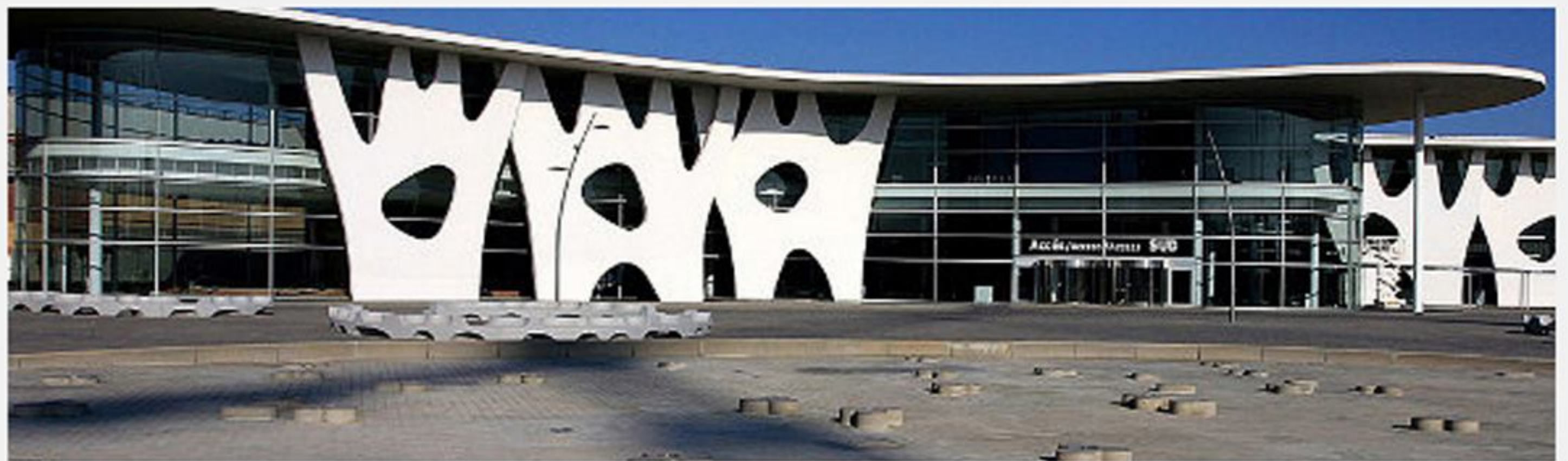
Nou recinte firal de Gran Via

"Orientats a l'acció. Experiències per millorar la farmàcia des del present" és el lema de la 27a edició del Congrés i Saló Europeu d'Oficina de Farmàcia, Infarma Barcelona 2015, punt de trobada idoni per posar en comú aquestes experiències; demostrar, de la mà de professionals, l'eficàcia d'una farmàcia amb un paper cada cop més important en la cadena assistencial ; i en definitiva, tractar i debatre temes que suposen una oportunitat de creixement per al sector. Aquesta cita europea de la farmàcia tindrà lloc a Barcelona els dies 24, 25 i 26 de març de 2015 i està organitzada conjuntament pels Col·legis de Farmacèutics de Madrid i Barcelona, amb la col·laboració d'Interalia.