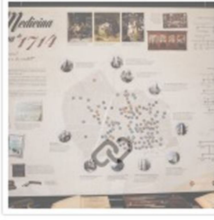
La pràctica de la medicina a la Barcelona del 1714