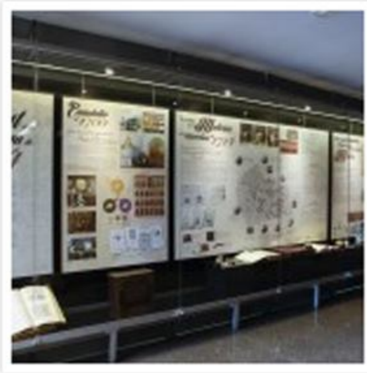
Exposició al COMB