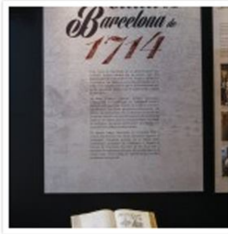
El llibre de Jacques Barrelier