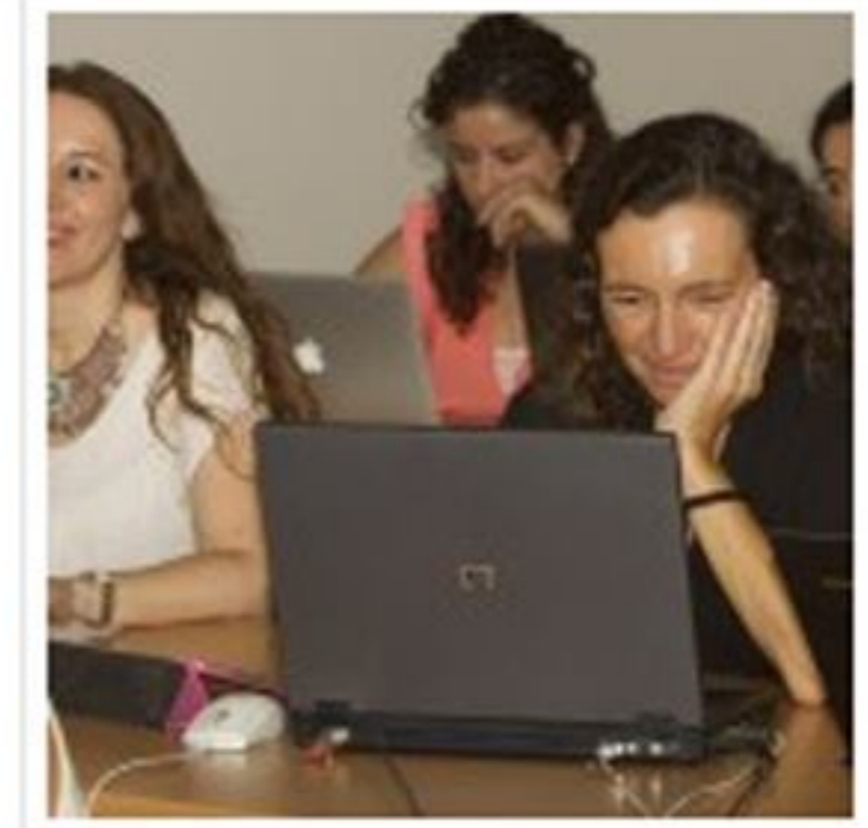
Alumnes assistents al curs