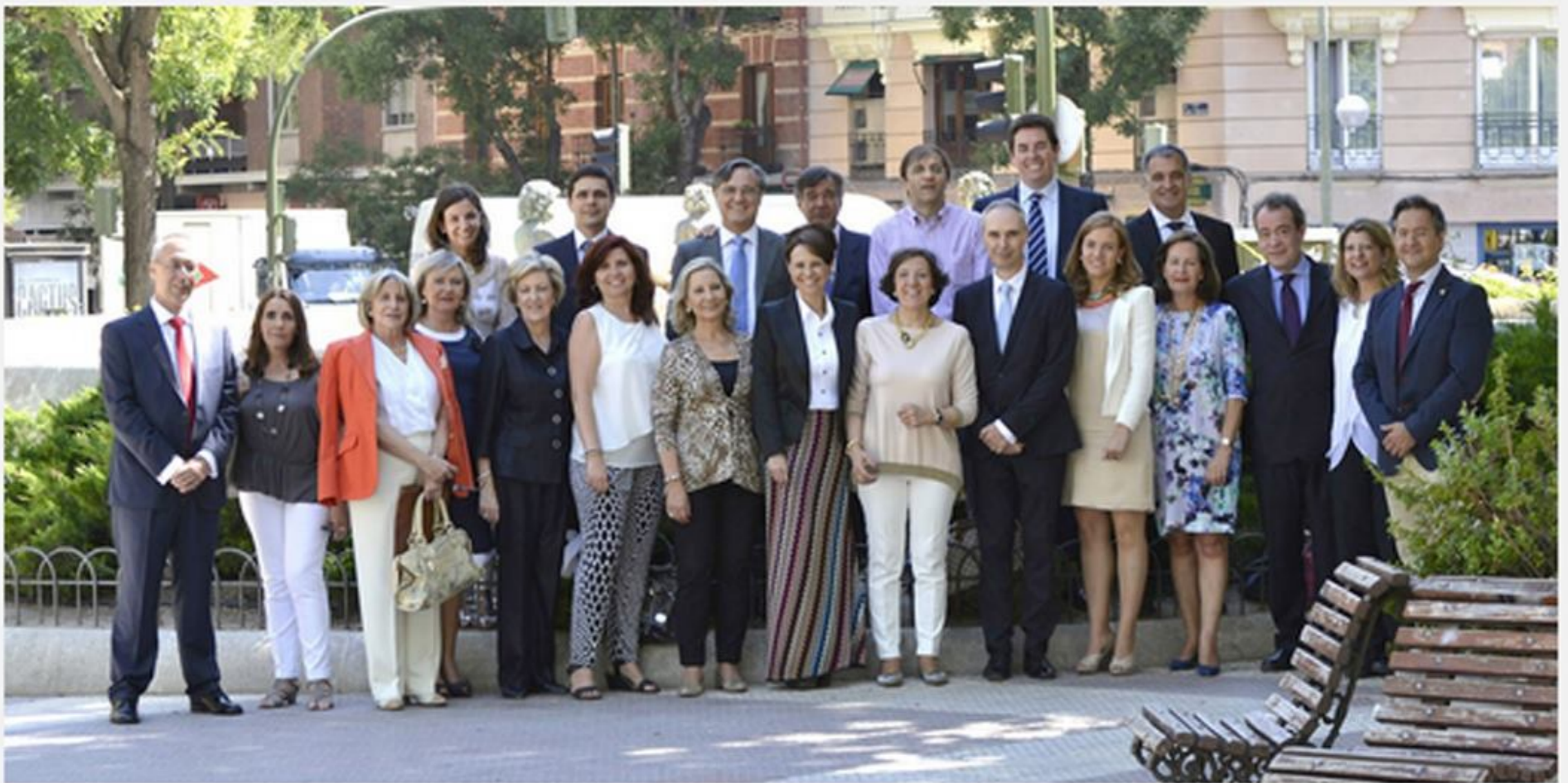
La nova Junta de Govern del Col·legi de Farmacèutics de Madrid

És una cosa que hem de decidir tots els professionals. Juntament amb el Col·legi Oficial de Farmacèutics de Barcelona, vam obrir un procés de reflexió amb els col·legiats per conèixer quines eren les seves expectatives i motivacions. Ens vam trobar amb un acord ampli: el futur exigeix una major implicació del farmacèutic en el tractament farmacològic del pacient i cal oferir respostes assistencials més ajustades als problemes i necessitats reals dels pacients, perquè ja no n'hi ha prou amb la nostra labor de dispensació de medicaments. Aquest crec que és l'eix sobre el qual ha de girar qualsevol actuació farmacèutica futura. Em sembla molt interessant en aquest sentit potenciar els serveis socio-sanitaris, tenint en compte la piràmide demogràfica de la població. Podem fer una gran labor i ho estem demostrant ja en el seguiment dels pacients crònics i polimedicats i en moltes àrees com la dependència, la nutrició o en tot el que té a veure amb les polítiques de promoció de la salut. És un camí que considero molt estimulants per a la professió, sempre i quan assegurem bé l'estabilitat econòmica del sector i ens dotem d'un marc normatiu que ens permeti créixer com a professionals.