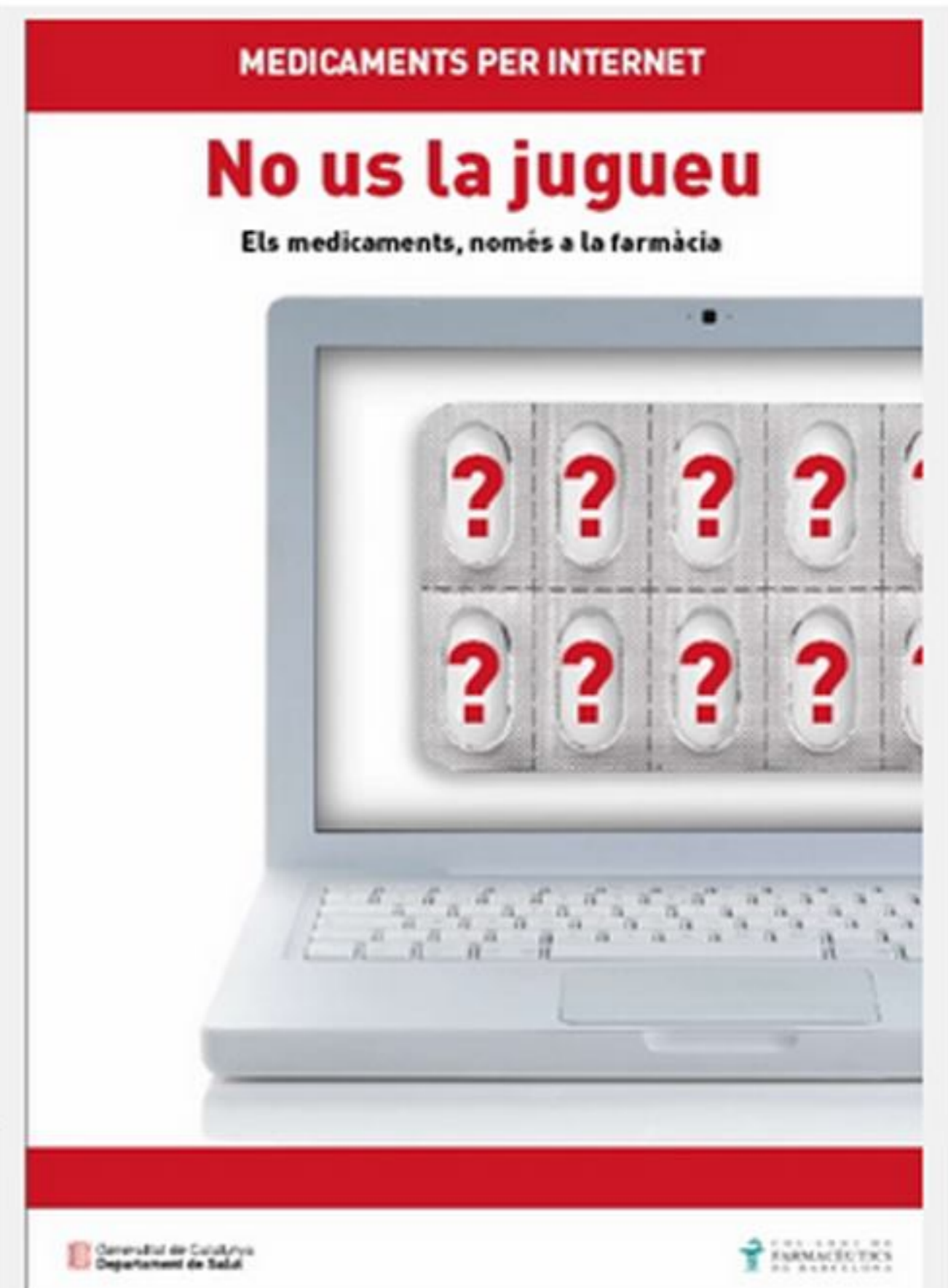
Pòster de la campanya