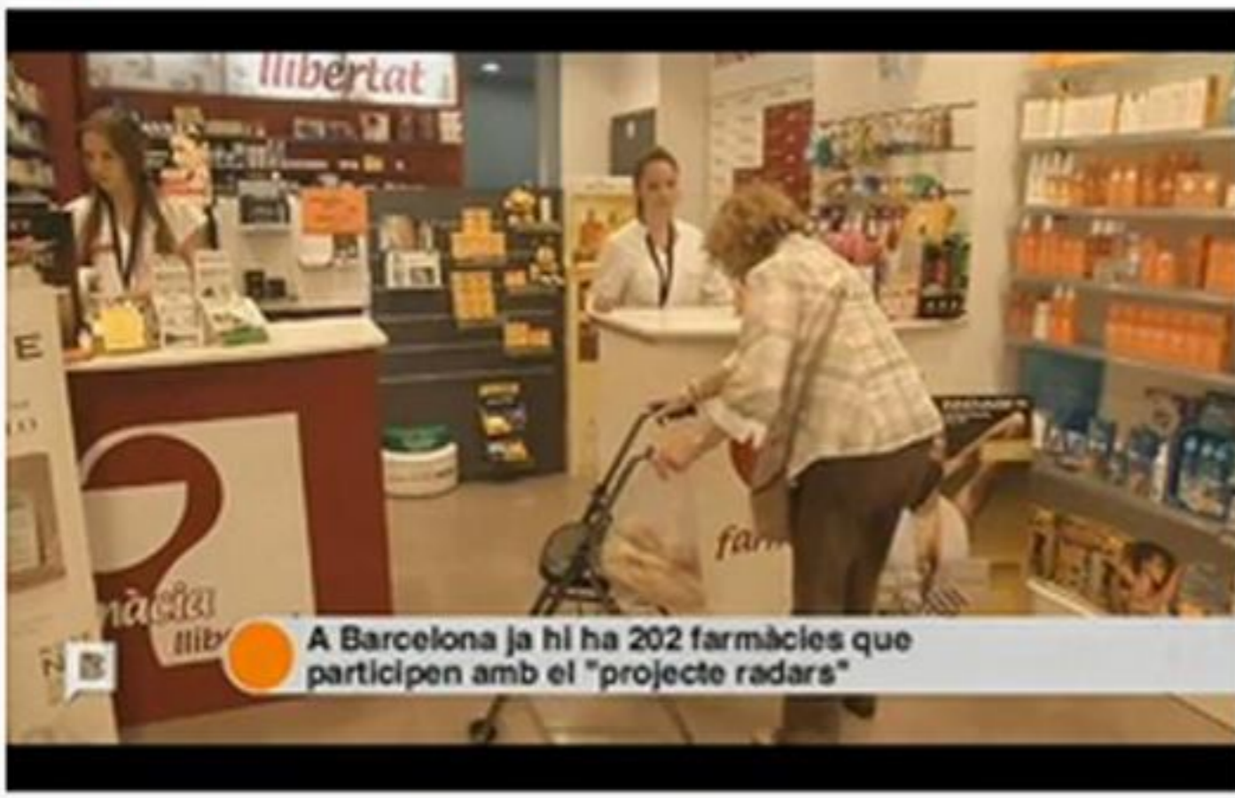
A Barcelona ja hi ha 202 farmàcies que participen amb el "projecte radars"

Els farmacèutics, gràcies a la seva proximitat, professionalitat i confiança amb els usuaris tenen un paper fonamental en l'educació sanitària, promoció de la salut i la prevenció de la malaltia, per aquest motiu s'estan duent a terme diferents projectes i acords que persegueixen enfortir l'Atenció Farmacèutica a les farmàcies.