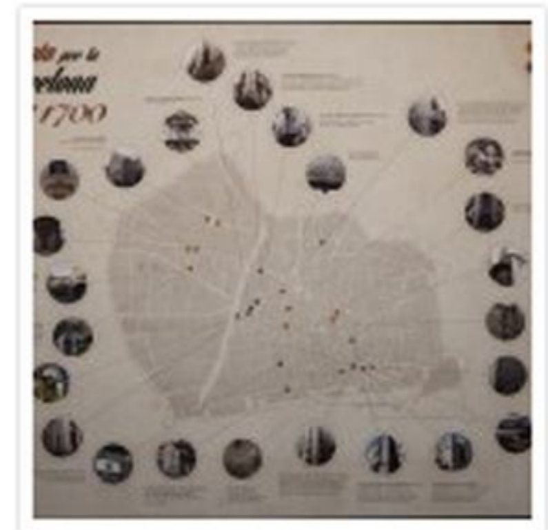
Ruta per la Barcelona mèdica del 1700