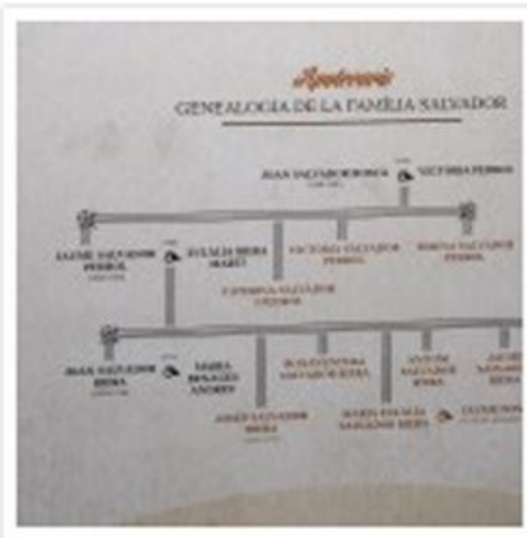
Genealogia de la família de farmacèutics i metges Esteve-Steve