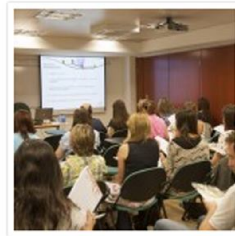
Assistents al tercer nivell del curs de Flors de Bach