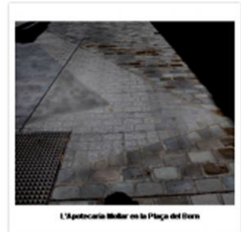
Línies on es localitza l'apotecaria Mollar; la primera (a la dreta) és la línia més propera al paret, i la segona (a l'esquerra) és l'apotecaria

Una altra de les apotecaries enderrocades és la Padrell . Aquesta, però, després de ser enderrocada es va traslladar al carrer Sant Pere més baix, i avui dia segueix amb la seva activitat. Datada del 1561, és considerada no només l'apotecaria més antiga de Barcelona, sinó també la botiga amb més anys de la ciutat , perquè quan un establiment es trasllada aquest fet no invalida la seva antiguitat.