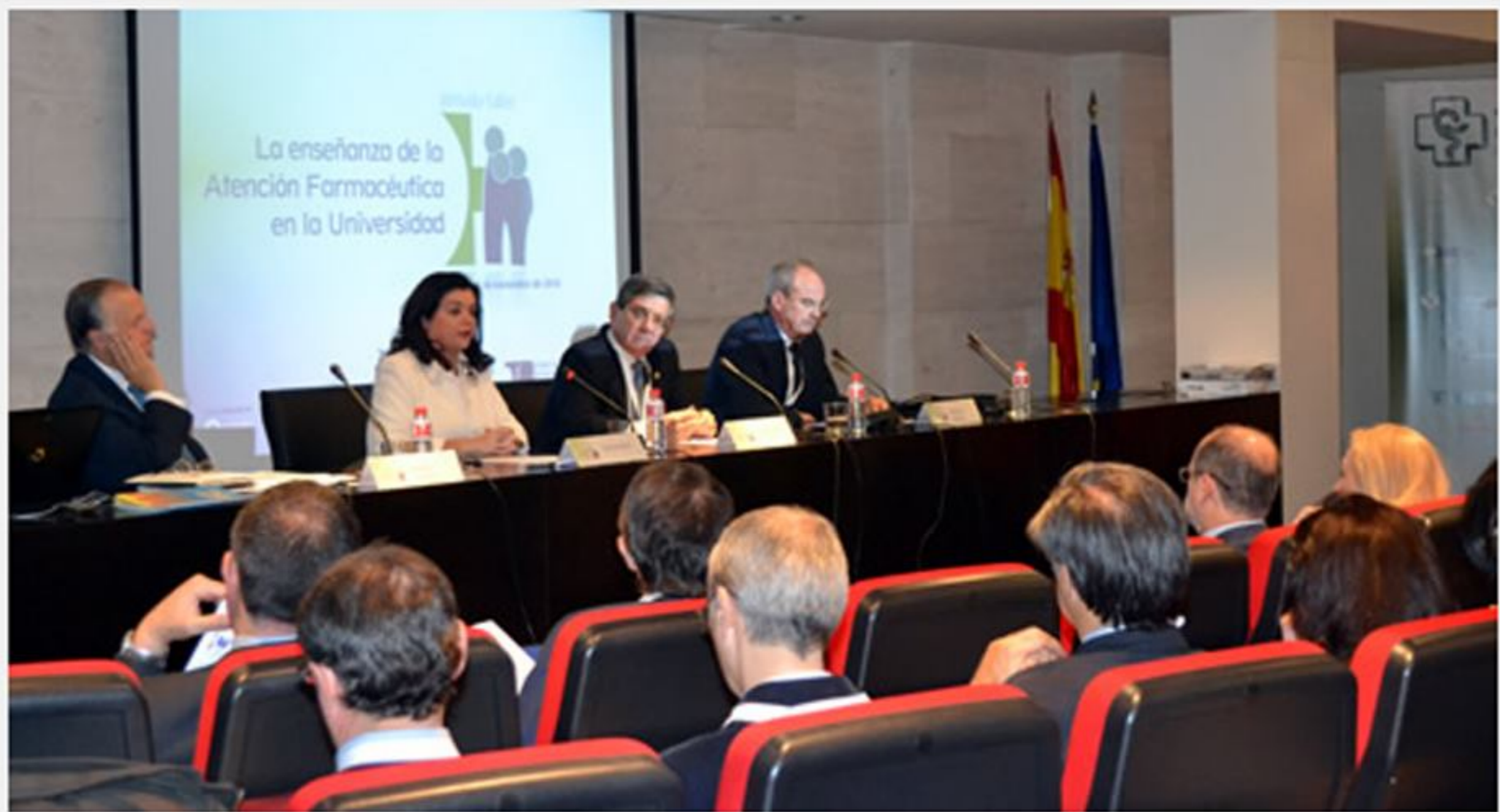
Presentació de la Jornada a la seu del Consejo.

El Consejo General de Colegios Oficiales de Farmacéuticos va acollir el 6 de novembre la Jornada-Taller "L'ensenyament de l'Atenció Farmacèutica a la Universitat" organitzada pel Foro de Atenció Farmacèutica en Farmàcia Comunitaria (Foro AF-FC) per fomentar la relació entre la universitat i la professió, així com avaluar les necessitats formatives dels graduats en Farmàcia d'acord al futur d'una professió que en la seva vessant assistencial ha de centrar-se en els serveis professionals i el pacient.