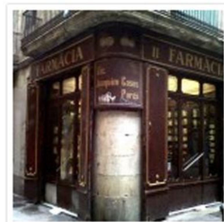
Farmàcia que hi ha on estava l'apotecaria Saurina