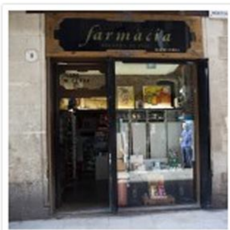
Farmàcia que hi ha on estava l'apotecaria Vilardaga