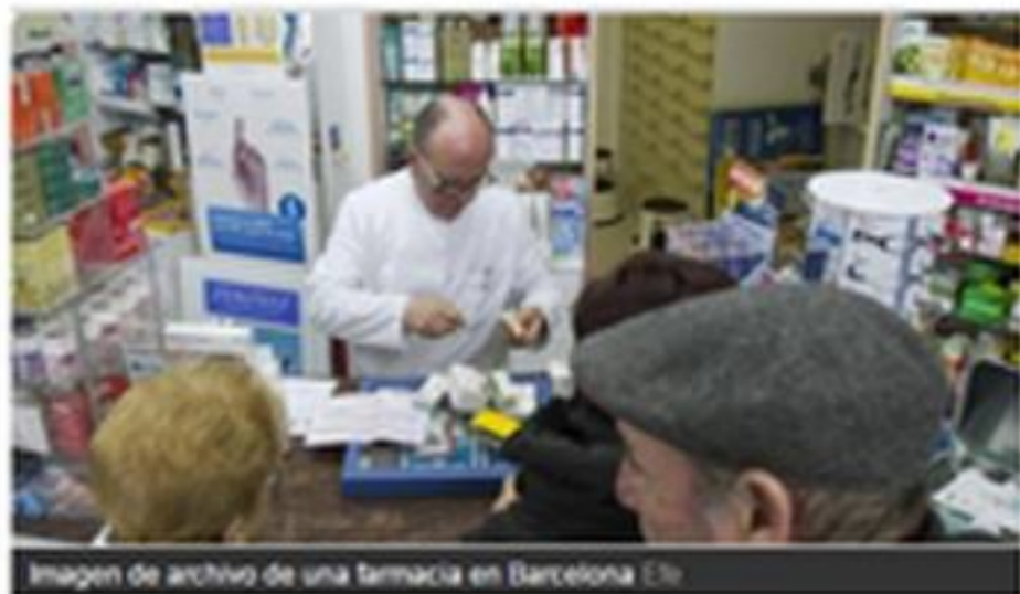
Imagen de archivo de una farmacia en Barcelona

Me gusta 107 Twitter 52 Facebook 18 Ver Comentarios