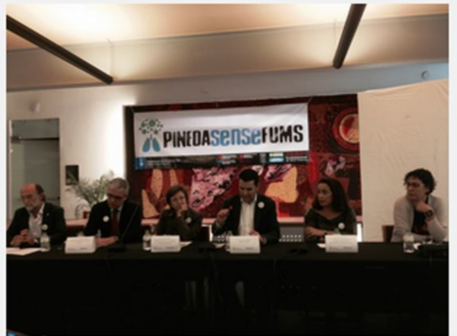
Presentació de la campanya a l'Ajuntament de Pineda de Mar.