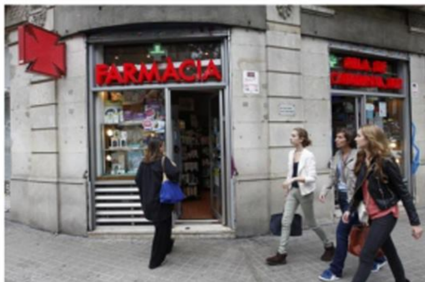
Una farmacia del centro de Barcelona el día en que el sector hizo huelga por los impagos del Govern.

Las boticas fomentarán la prestación de servicios asistenciales y su especialización.