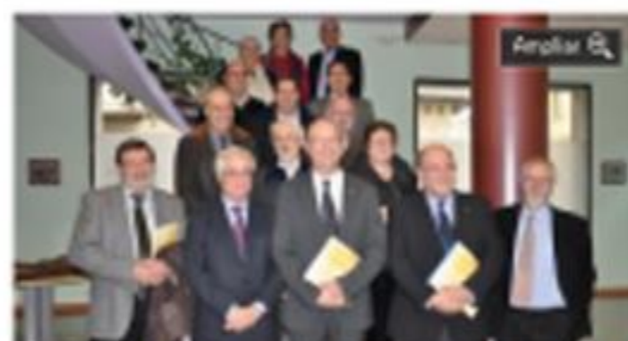
Salut estén el programa de detecció precoç de càncer de còlon i recte a la Garrotxa i el Ripollès. Departament de Salut

RIPOLL | ACN Salut estén, a partir de gener, el programa de detecció precoç de càncer de còlon i recte a Osona, la Garrotxa i el Ripollès. Aquest projecte, situat en el marc del Pla de Salut de Catalunya 2011-2015 de potenciar els aspectes preventius, està adreçat a la població que té més possibilitats de patir aquest tipus de tumors. En els propers dos anys, convidaran 56.554 persones de les tres comarques a fer-se la prova. L'objectiu és que homes i dones d'entre 50 i 69 anys vagin a la farmàcia a fer-se un test que detecta la presència de sang en femta, un dels símptomes d'aquest tipus de càncer. A Catalunya cada any es diagnostiquen més de 4.000 nous casos i és la segona causa de mort per càncer al país.