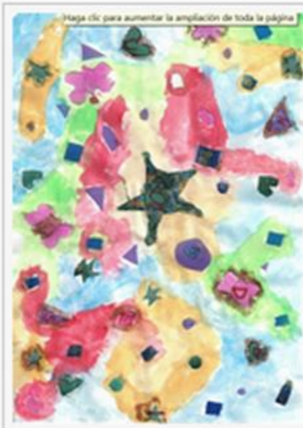
En la categoria de 6 a 7 anys Carla Roca Canals (7 anys)