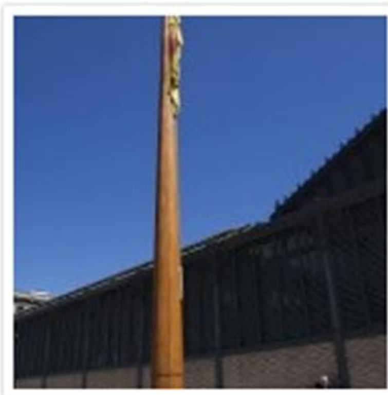
Monument del masteler, a la plaça del Born

La Comissió de Jubilats ha pogut trobar, gràcies a l'ajuda del Centre Cultural del Born, una de les apotecaries que es van enderrocar aleshores: l'apotecaria Mollar. Aquesta es pot localitzar a la plaça del Born (tot i que posteriorment es va traslladar al Passeig del Born), on hi ha el monument del masteler, dedicat als lluitadors del 1714. Allà a terra està marcada amb una línia l'apotecaria, que estaria a la planta baixa, al nivell del jaciment del Born, mentre que al primer pis hi havia una confraria.