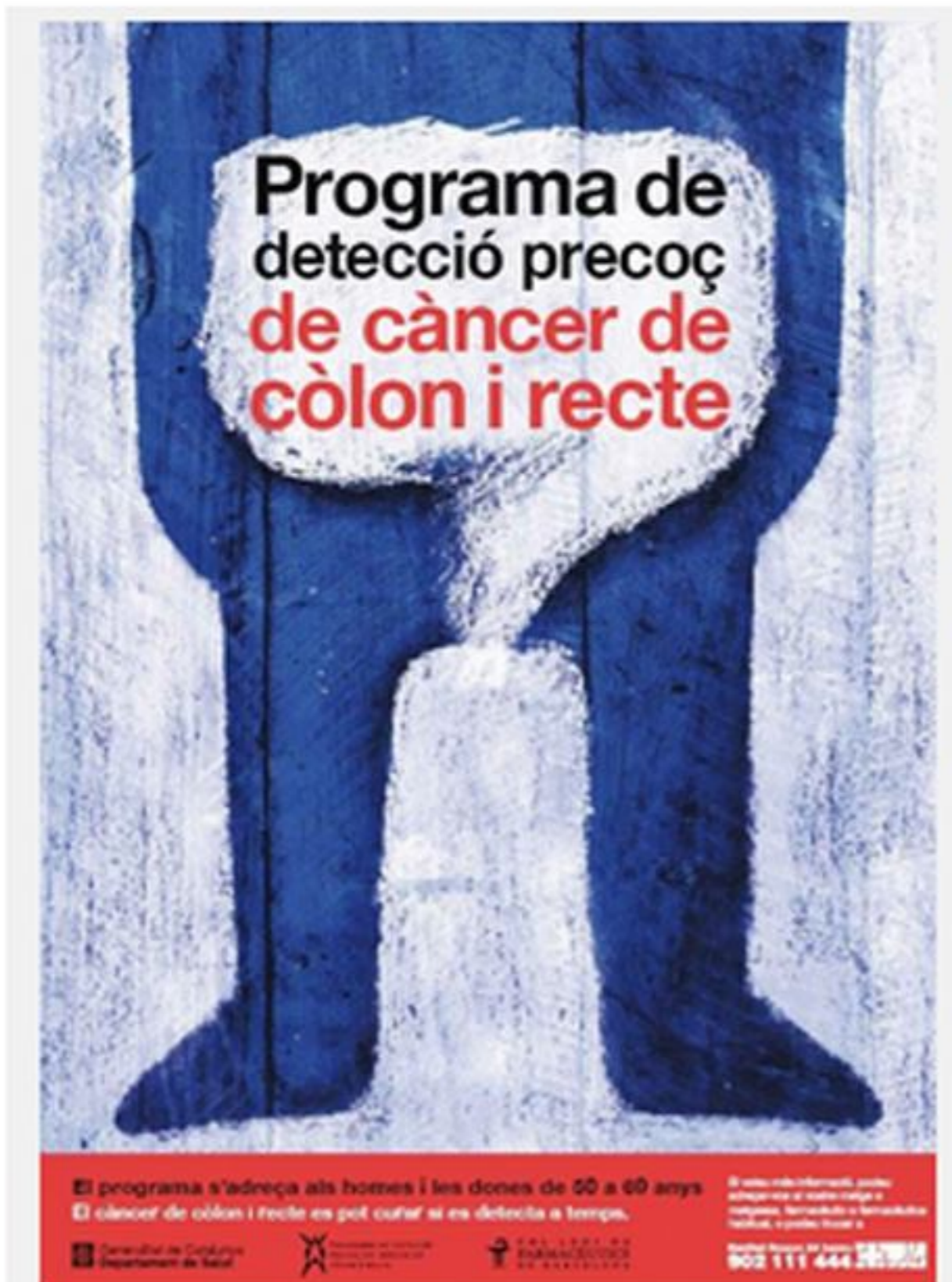
Cartell del programa de detecció de càncer de còlon a les farmàcies de Barcelona

Al mes de gener es posarà en marxa el Programa de Detecció Precoç de Càncer de Còlon i Recte (PDPCCR) a les comarques d'Osona, la Garrotxa i el Ripollès, en el marc del seu desplegament progressiu a tota Catalunya.