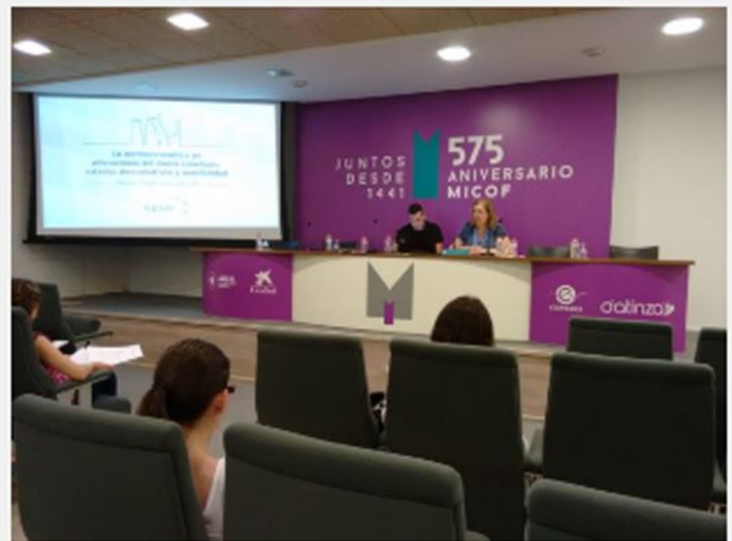
Videoconferència al Col·legi de Farmacèutics de València