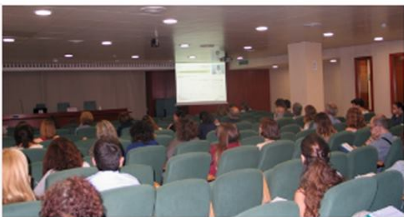
La sessió es va dur a terme en format videoconferència

A Espanya, nou de cada deu persones estan preocupades per algun problema capil·lar. El farmacèutic comunitari pot promoure l'atenció i la cura capil·lar entre els usuaris amb el consell adequat a cada situació i la recomanació d'un servei o d'un producte específic a cada cas. Aquest seminari tenia per objectiu reforçar el coneixement i el consell capil·lar centrant-se en els estats descamatiu i en la sensibilitat del cuir cabellut, i proporcionar un enfocament mèdic i farmacèutic basat en protocols d'actuació davant de diferents situacions amb l'objectiu d'escollir el tractament dermofarmacèutic més adient.