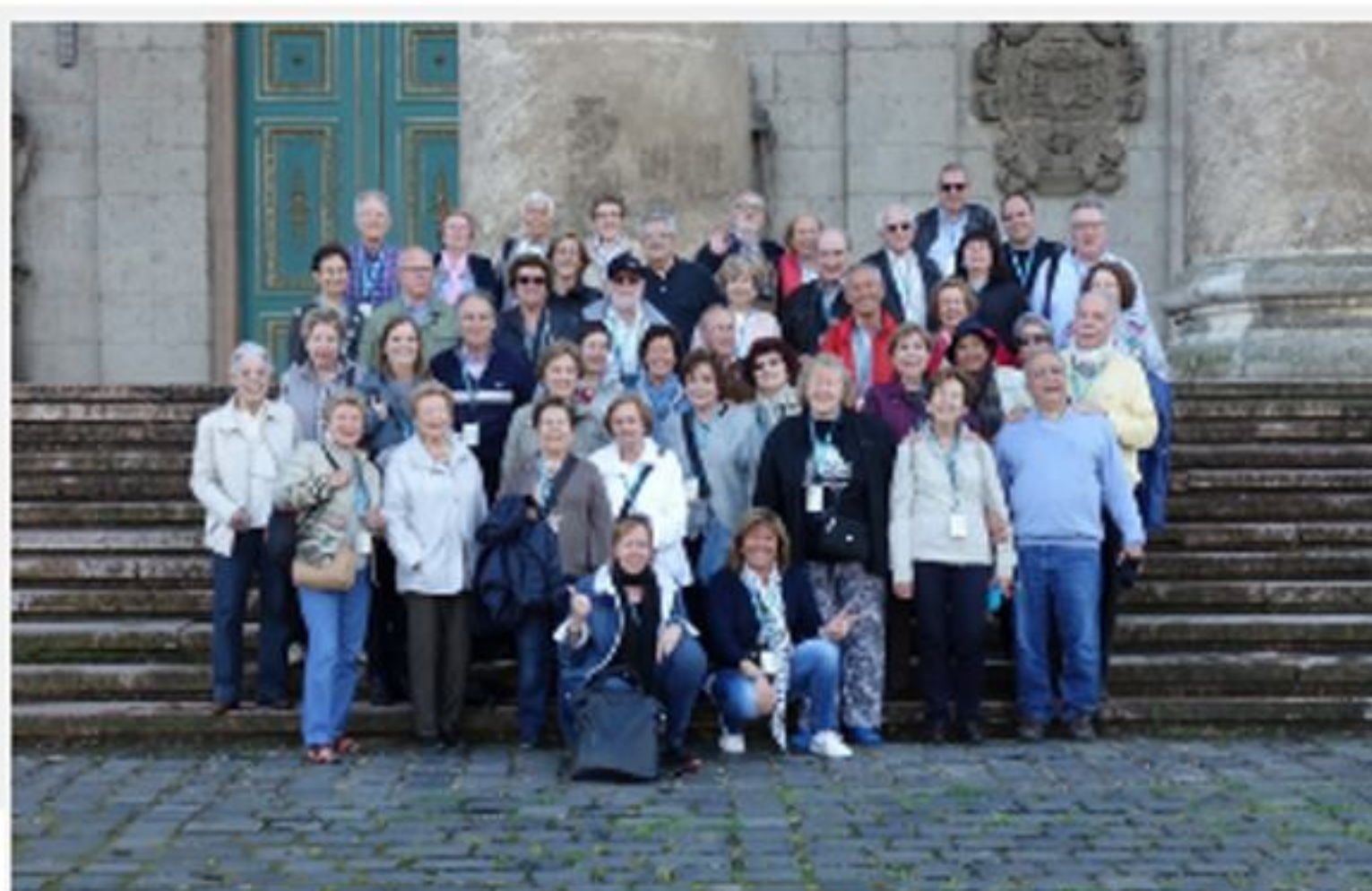
Foto de grup del viatge a Budapest

Un grup de 76 sèniors amb ganes de viatjar, format per 30 col·legiats sèniors del Col·legi de Farmacèutics, 20 socis de Mutual Mèdica, 18 mutualistes de Mutuam i 8 socis de Clinicum, van fer les maletes il·lusionats per conèixer la capital d'Hongria del 6 al 10 de maig.