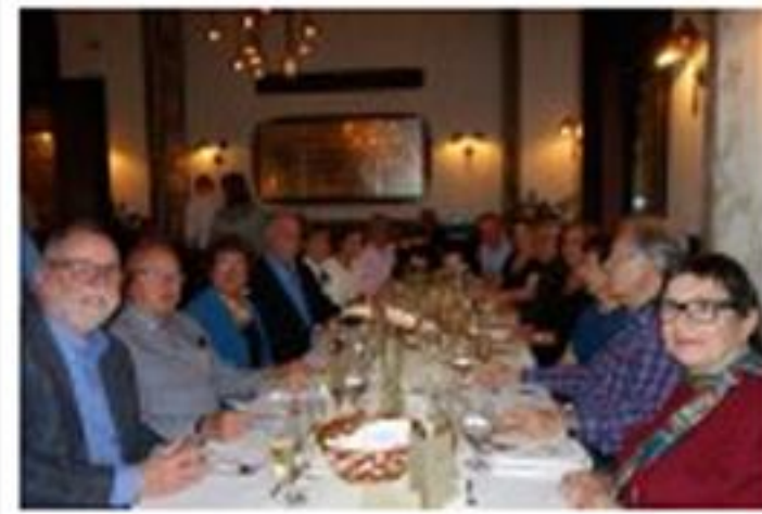
Sopar a restaurant Callas