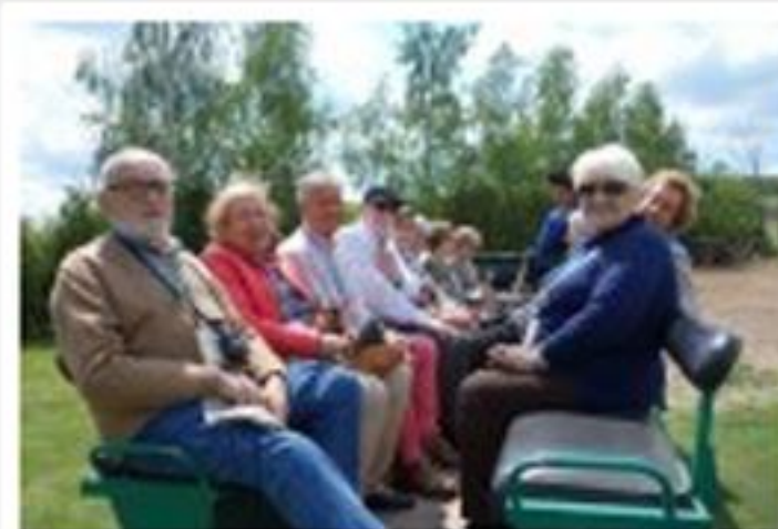
Passejada en cotxe de cavalls