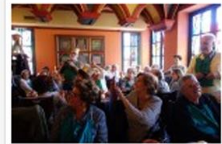
Ambient al dinar medieval