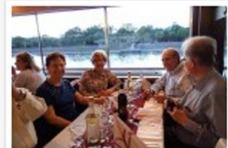
Sopar al vaixell pel riu Danubi

Teniu més informació sobre com va anar aquest viatge al Blog de Mutuam: Els viatgers de Mutuam Activa a Budapest ... impossible d'oblidar!