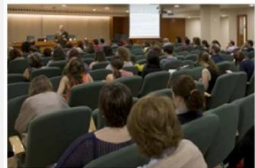
Diariofarma i la formulació