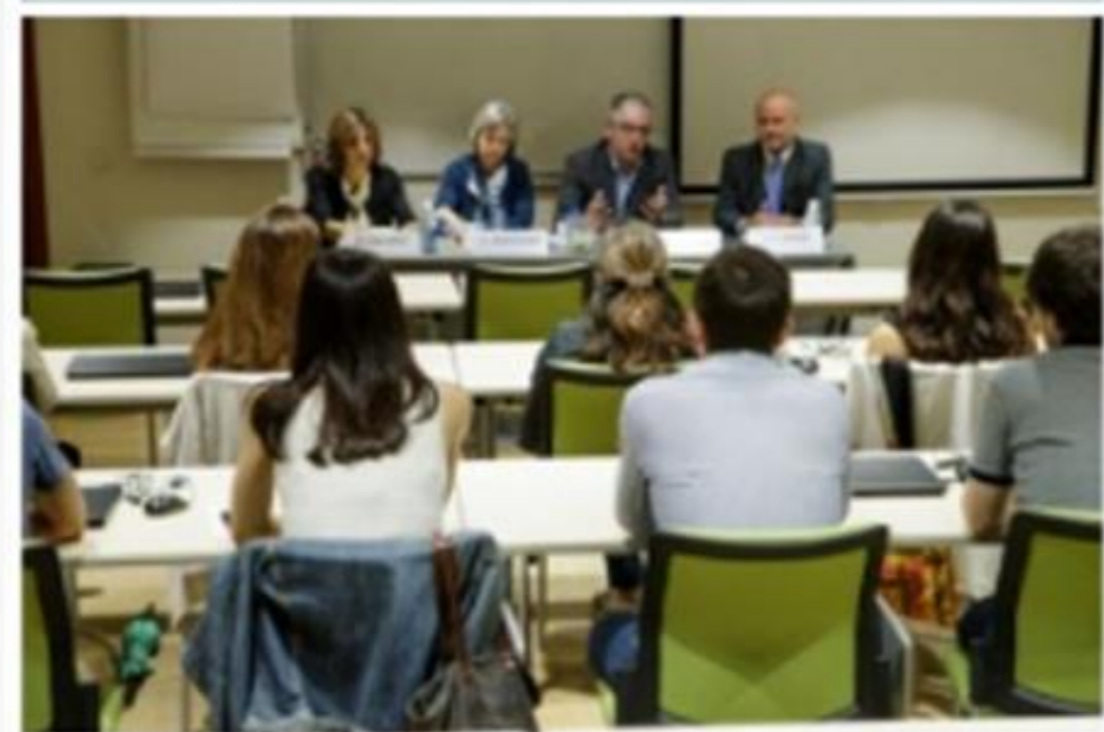
Imagen de la clausura de la 12ª edición del Máster de Gestión del COF de Barcelona

Barcelona Cataluña COF de Barcelona Facultad Farmación Gestión Marketing