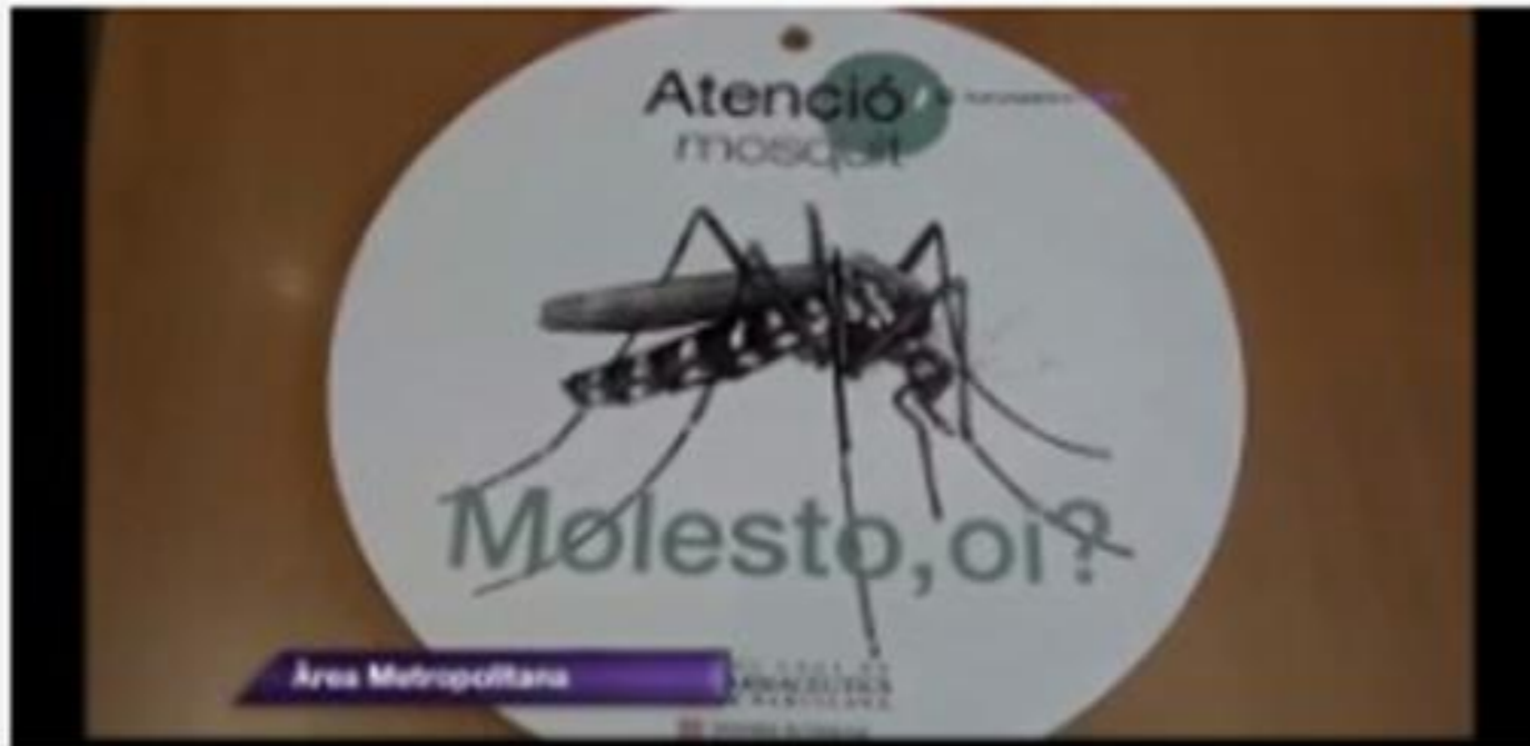
La campanya contra el mosquit tigre, Al Dia Llobregat d'Espluges Llobregat

La campanya contra el mosquit tigre al Baix Llobregat va ser un dels altres projectes destacats al juny. L'informatiu Al Dia Llobregat d'Esplugues Televisió la va explicar remarcant el principal objectiu de la iniciativa, combatre la proliferació de l'insecte a la comarca del Baix Llobregat . La premsadelbaix i El Far són els dos altres mitjans que també en van informar.