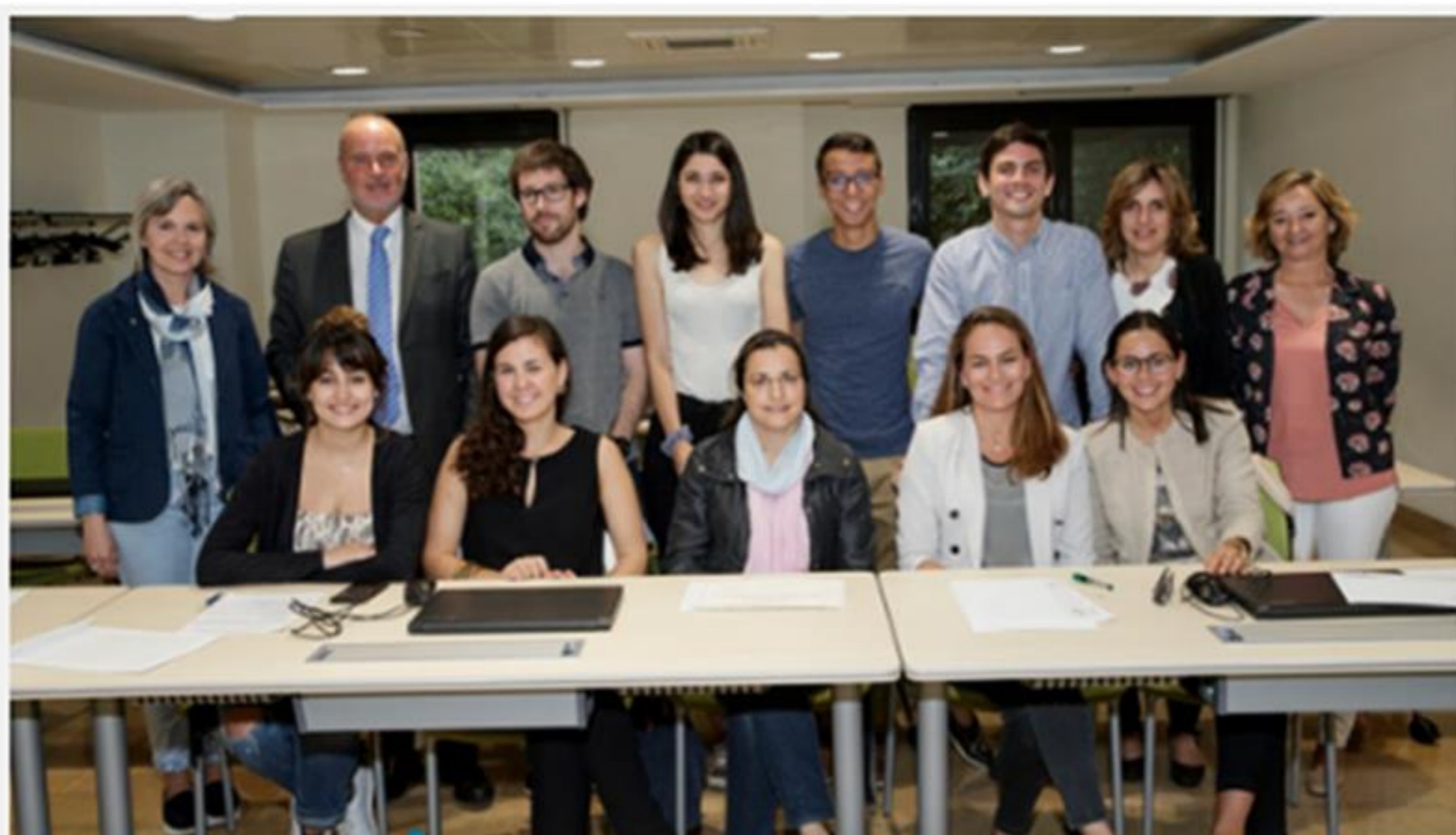
Foto de família de la 12a edició del MGOF