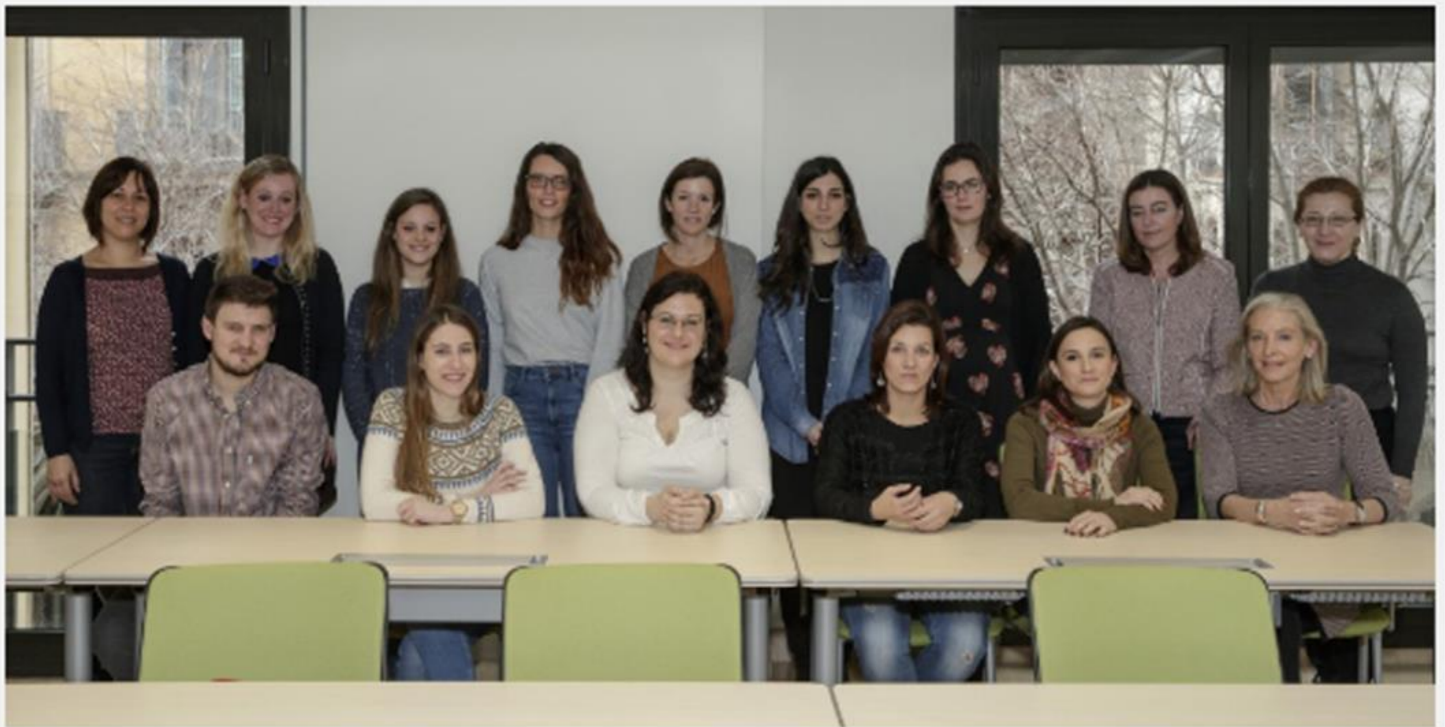
Alumnes de la primera edició del Programa DermoExpert del COFB