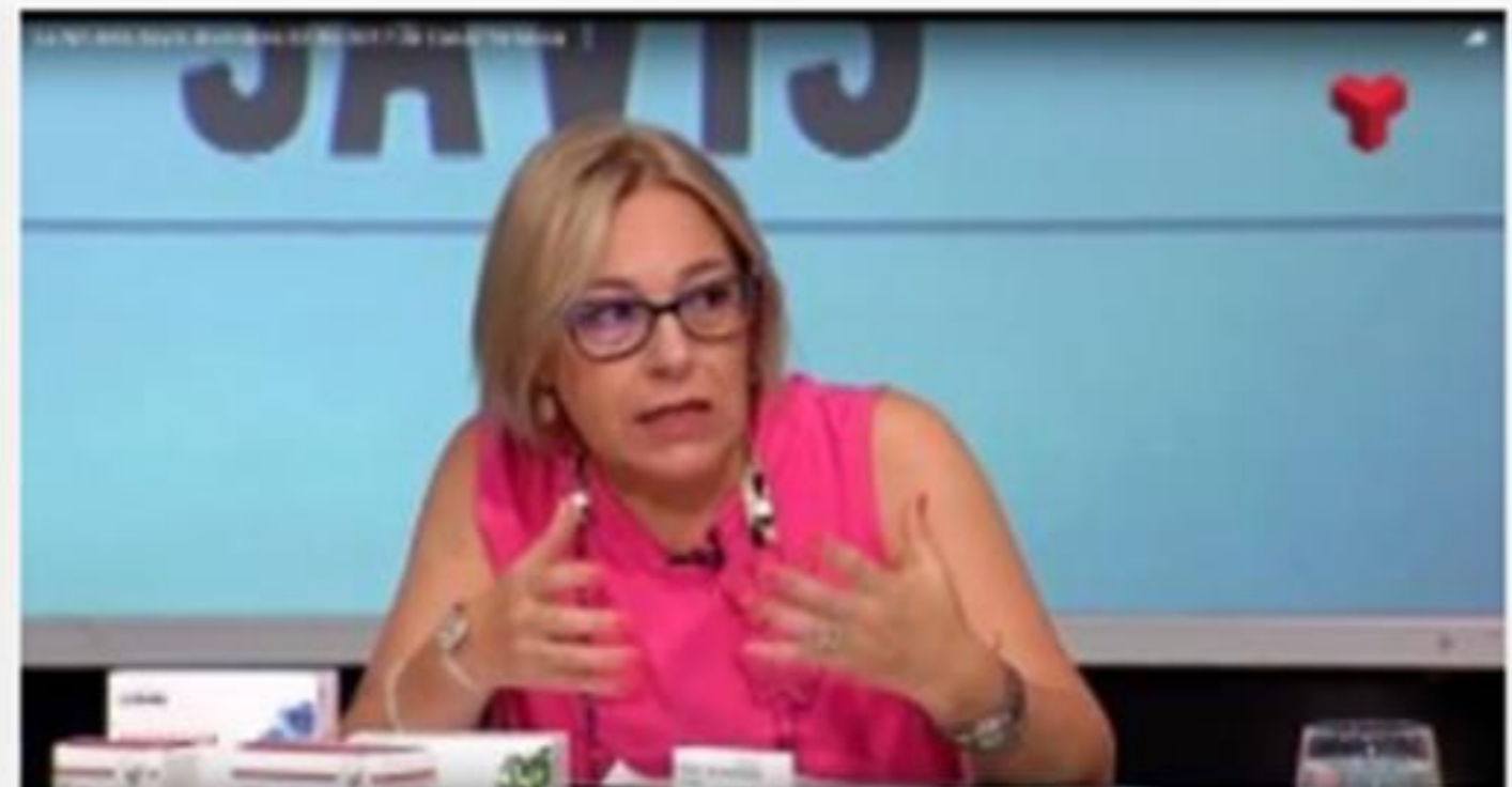
El bon ús dels medicaments, tema tractat per Canal Terrassa

Finalment, La Vanguardia va comunicar la intenció de l'Ajuntament de Barcelona d'incentivar el projecte Radars , la xarxa de prevenció i d'acció comunitària adreçada a detectar i prevenir situacions de risc de les persones grans i de la qual les farmàcies comunitàries en són un agent particip.