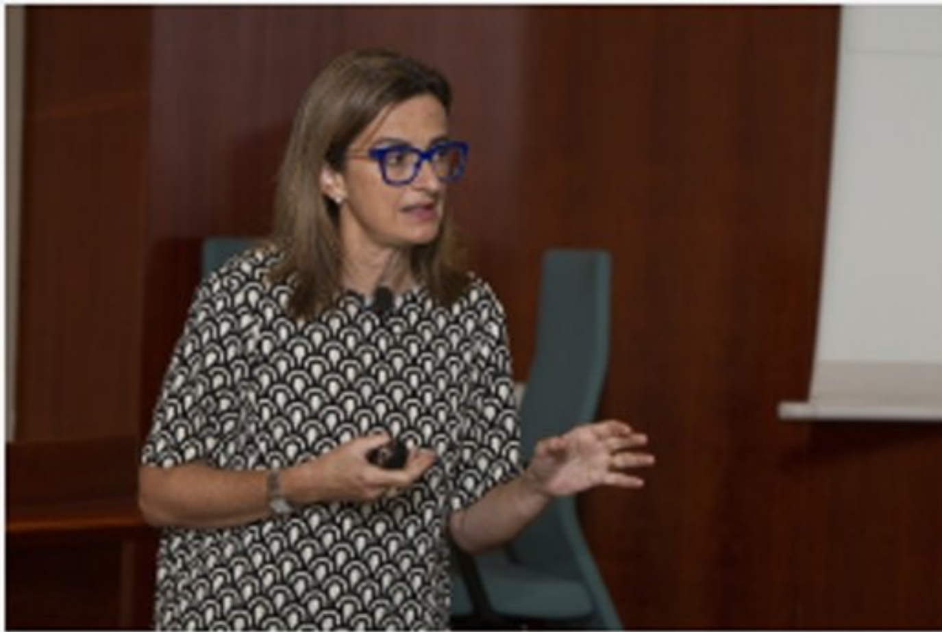
La Doctora Izquierdo durant la conferència sobre nutrigenètica