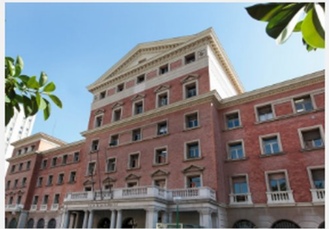
La Facultat de Farmàcia i Ciències de l'Alimentació de la Universitat de Barcelona