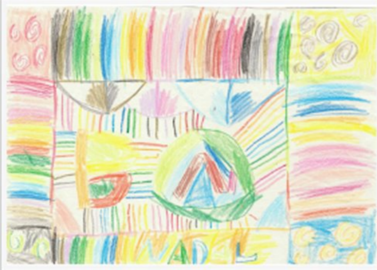
En la categoria de 6 a 7 anys: Irene Vives Aguilar